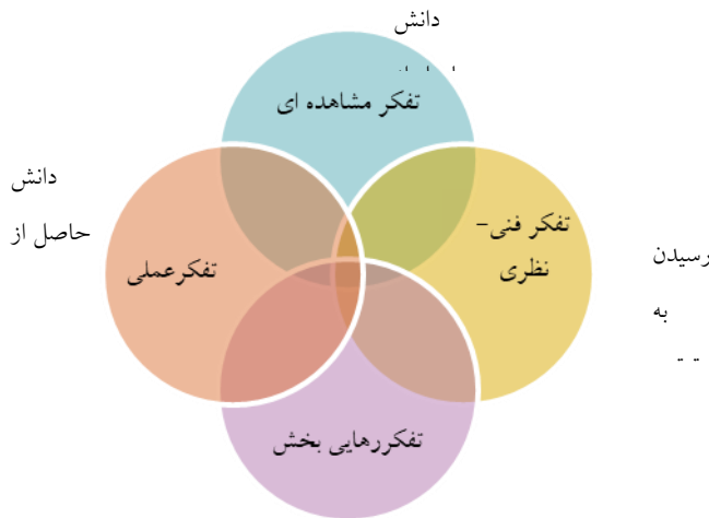
شکل ۱) مدل نظری فرا تفسیری روایت‌نگاری تأملی و توسعه حرفه‌ای

کدام معرف دانش مجزایی است: دانشی که از مشاهده رفتار دیگران کسب می‌شود، دانشی که در موقعیت‌های آموزشی رسمی با اهداف از پیش تعیین شده حاصل می‌شود، دانشی که حاصل به اشتراک‌گذاری با دیگران است و دانشی که با انتقال به موقعیت‌های جدید به دست می‌آید. چهار نوع تفکر مجزا و در عین حال، مرتبط با هم که از این معرفت‌های چهارگانه حمایت می‌کنند عبارتند از: تفکر مشاهده‌ای، تفکر فنی-نظری، تفکر عملی و تفکر رهایی‌بخش.