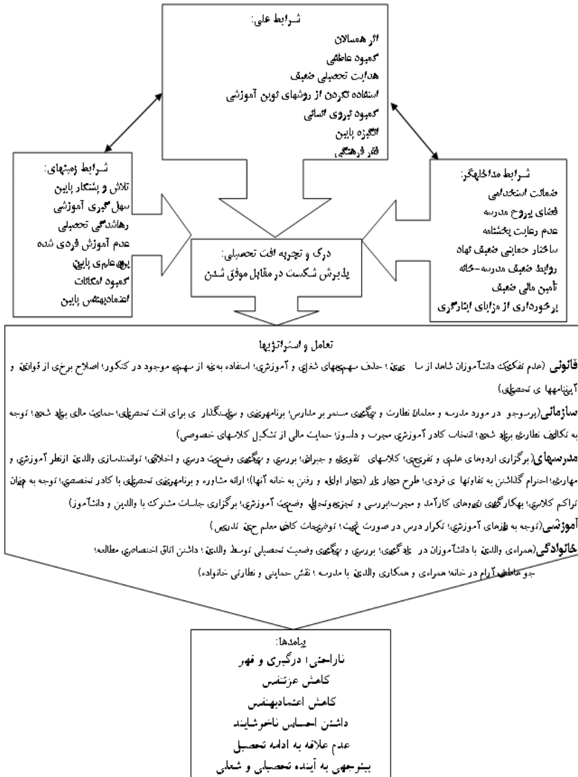
شکل ۲- مدل پارادایمک: افت تحصیلی به‌مثابه پذیرش شکست در مقابل موفق شدن

در مدل پارادایمک پژوهش (شکل ۲)، کنشگران درگیر در افت تحصیلی، این پدیده را به‌مثابه «پذیرش شکست در مقابل موفق شدن» درک و تجربه می‌کنند.