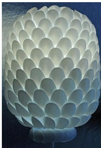
شکل ۱- تلفیق هنر تجسمی و مواد دور ریختنی و ایجاد گل