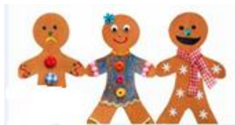
تصویر شماره ۱: دو و نیم!

و نهایتاً مثالی از طنزهای کلامی ارائه شده توسط معلم، بیان حکایت مردی است که به رستوران می رود و در پاسخ به سؤال پیشخدمت که از او می پرسد " پیتزای را به ۴ قسمت تقسیم کند یا ۸ قسمت؟" می گوید " لطفاً ۴ قسمت برش بزنید چون من رژیم دارم!!!"