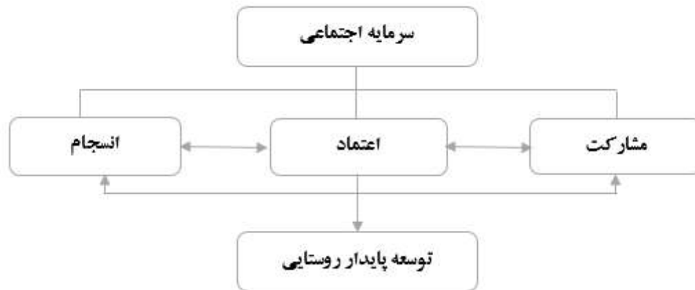
شکل ۱. مدل نظری پژوهش

اعتماد، هسته مرکزی بسیاری از مفاهیم کاربردی موجود در تئوری‌های علوم اجتماعی است که برای تبیین فرایندهای زندگی روزمره از جمله رضایت از زندگی، رونق اقتصادی، آموزش، رفاه، مشارکت، جامعه مدنی، دموکراسی، مردم سالاری و غیره به کار گرفته می‌شود (Delhey, Newton, & Welzel, 2011). در بررسی ادبیات جامعه‌شناختی مفهوم اعتماد به سه رهیافت فکری وجود دارد: اعتماد به منزله ویژگی فردی افراد، اعتماد به منزله عاملی در ارتباطات اجتماعی و نهایتاً هم اعتماد به عنوان ویژگی نظام اجتماعی با تأکید بر رفتار مبنی بر تعاملات و سوگیری‌ها در سطح فردی، مفهوم‌سازی شده است (Miszta, 2001). با عنایت به مفهوم سرمایه اجتماعی و ابعاد سه گانه آن مدل مفهومی تحقیق به شکل زیر ارائه می‌گردد.