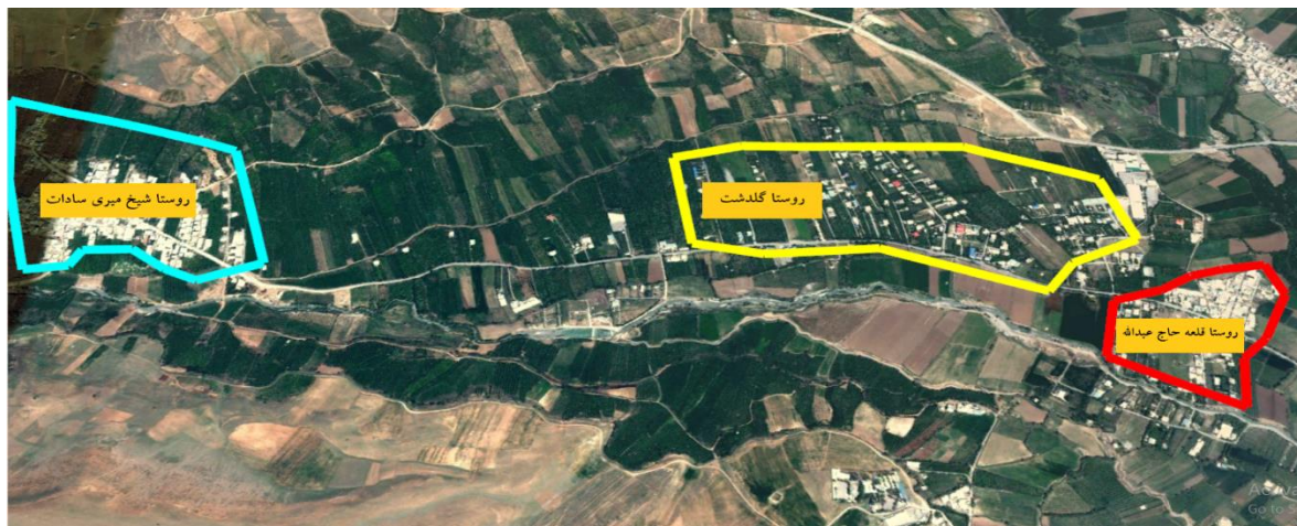
شکل ۳. منطقه روستا شهری گلدشت در سال ۱۳۹۰