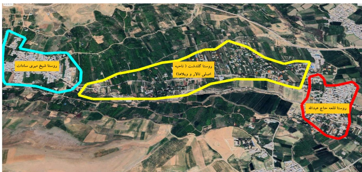
شکل ۴. منطقه روستا شهری گلدشت در سال ۱۴۰۲