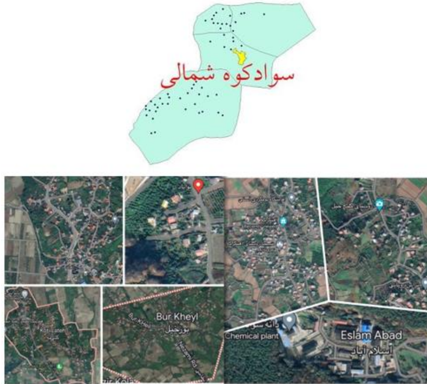
شکل ۲. محدوده مورد مطالعه در تقسیمات استان مازندران