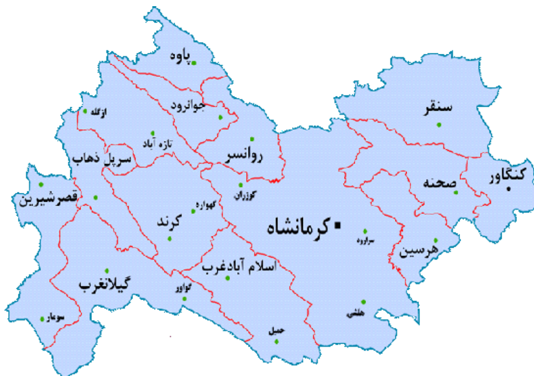
شکل ۱. نقشه استان کرمانشاه و محدوده‌های مکانی پژوهش