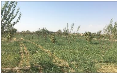
شکل ۳. تغییر کاربری شالیزار به باغ میوه در ناحیه لنجان سفلی

وجود آمده در فرایند تولید کشاورزی را به مثابه ناپایداری الگوی کشت ارزیابی می‌نمایند که پیامد آن تغییر و تخریب اراضی، تضعیف نظام اقتصاد کشاورزان و در نهایت افزایش مهاجرفرستی و تخلیه‌ی روستاهاست (شکل ۲ و ۳). درک تغییرات به وجود آمده به مثابه‌ی ناپایداری الگوی کشت در ناحیه روستایی لنجان در قالب یک مدل زمینه‌ای شامل عوامل تأثیرگذار / کنترل‌کننده، تأثیرات اولیه، پیامدهای اولیه و پیامد ثانویه در شکل ۴ ارائه شده است.