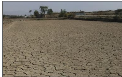
شکل ۲. عدم کشت و رهاسازی شالیزار در ناحیه لنجان علیا