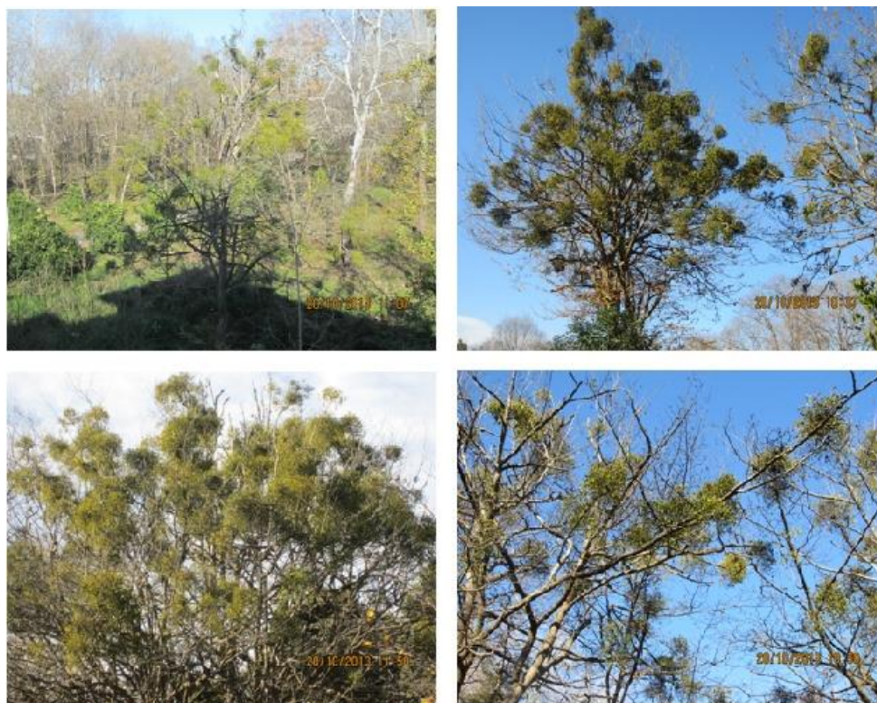
شکل ۱- نمونه‌هایی از درختان آلوده به دارواش با شدت‌های مختلف آلودگی.

به طور کلی، تحقیق حاضر به منظور کسب شواهدی مبنی بر تأثیر مخرب دارواش بر ثبات رشد و فعالیت فتوسنتزی گیاه انجیلی از طریق اندازه‌گیری برخی مشخصه‌هایی که اثبات‌کننده میزان تنش در یک گیاه هستند طراحی شده است.