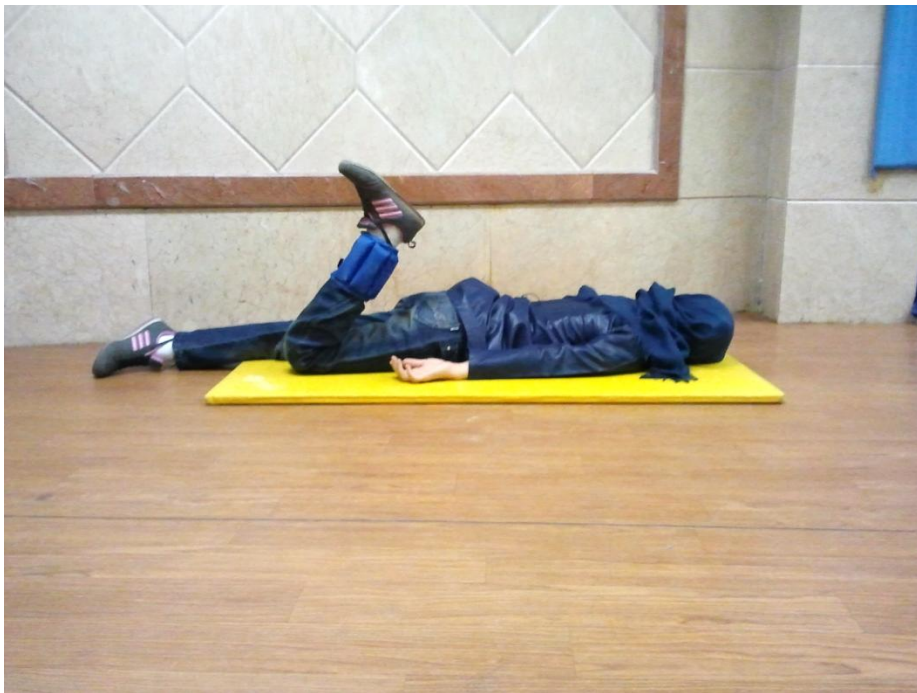
شکل ۲ تمرین قدرتی فلکشن زانو