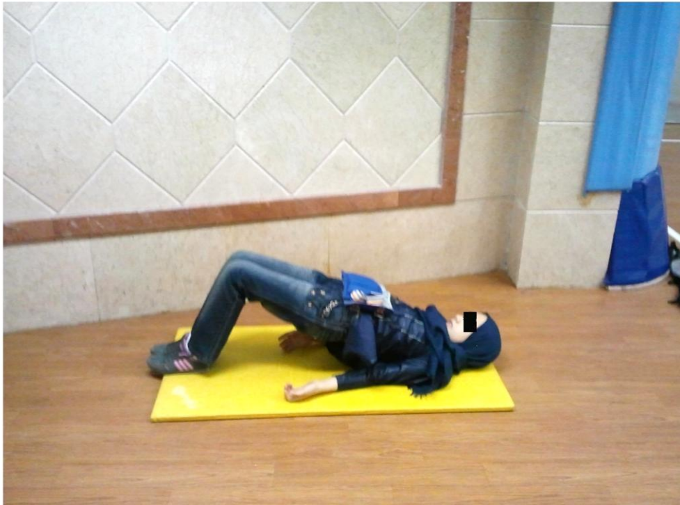
شکل ۱ تمرین قدرتی پل زدن

آماری با استفاده از نرم‌افزار اس پی اس اس نسخه ۱۶ در سطح اطمینان ۹۵ درصد \alpha در سطح معناداری ۰.۰۵ انجام شد.