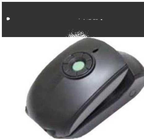
شکل ۱. سیستم آنالیزور لندمارک‌های بدنی

سیستم آنالیزور لندمارک‌های بدنی از یک قلم (فرستنده) و دوربین (گیرنده) که هر دو مجهز به سنسور IR هستند (کد ثبت اختراع: ۹۳۲۰۸) تشکیل شده است (شکل ۱).