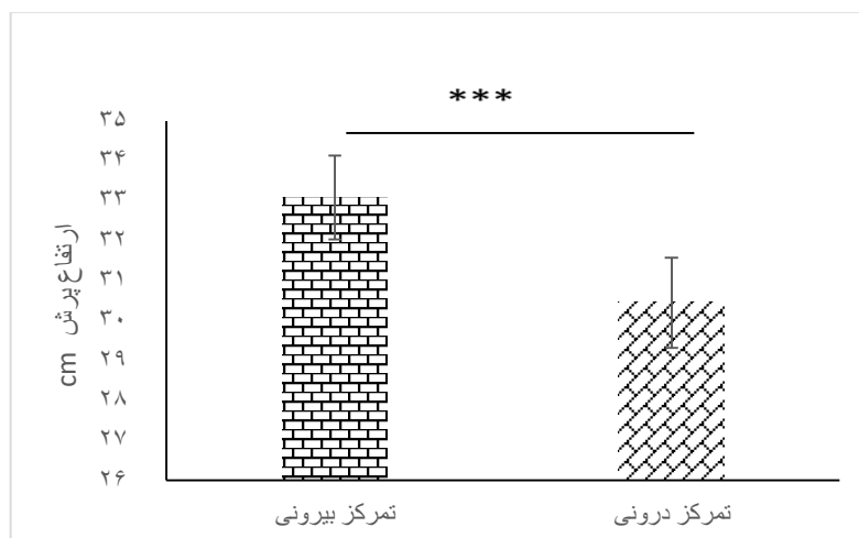
نمودار ۲. میانگین و انحراف استاندارد ارتفاع پرش در وضعیت کانون توجه بیرونی و درونی (***) معناداری در سطح P \leq 0.005

نتایج آزمون تی هم‌بسته نشان داد که میزان ارتفاع پرش آزمودنی‌ها در وضعیت کانون توجه بیرونی ( 33/081 \pm 3/6 ) به‌طور معنی‌داری بیشتر از وضعیت کانون توجه درونی ( 30/45 \pm 3/77 ) بود ( P=0/0005 ). ( t=8/673 ).