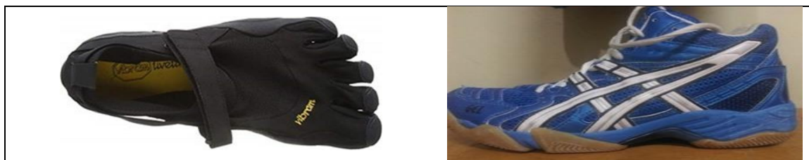
تصویر ۱: کفش آسیکس معمولی و کفش مینیمالیست پنج‌انگشتی