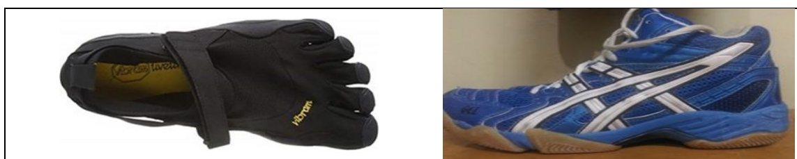
تصویر ۱: کفش آسیکس معمولی و کفش مینیمالیست پنج‌انگشتی