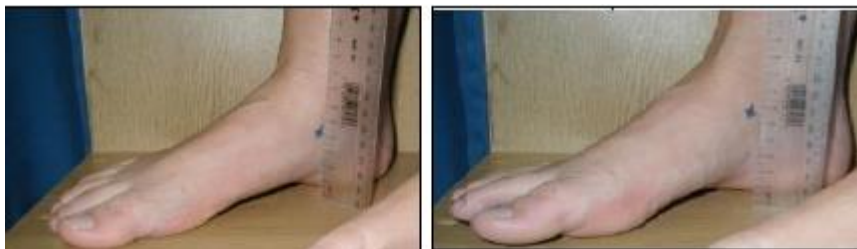
وضعیت بدون تحمل وزن

در ادامه مطالعه منصرف شدند. تمام فعالیت‌های تمرینی بازیکنان از ابتدا تا انتهای فصل در فرم ویژه به صورت روزانه به دست مربی تیم ثبت می‌شد. از کادر پزشکی تیم‌های مشارکت‌کننده درخواست شد آسیب‌های بازیکنان را در فرم ویژه ثبت کنند. این فرم‌ها به صورت هفتگی جمع‌آوری می‌شد. در این مطالعه، آسیبی ثبت می‌شد که در تمرین یا مسابقه رخ داده باشد و بازیکن آسیب‌دیده قادر نباشد در جلسه تمرینی یا مسابقه روز بعد تیم (حداقل ۴۸ ساعت) مشارکت جوید (تعریف آسیب بر مبنای غیبت از تمرین یا مسابقه) (۲،۶). در ابتدای این مطالعه، فرم رضایت‌نامه اخلاقی به دست بازیکنان امضا شد و سپس، در ابتدای فصل، افت ناوی پای چپ و راست، زاویه Q چپ و راست، زانوی پرائتزی، زانوی ضربدری و زاویه هایپیر اکستنشن مفصل زانوی بازیکنان اندازه‌گیری شد. برای اندازه‌گیری افت ناوی از آزمون برودی استفاده شد. برای این کار، ابتدا از آزمودنی درخواست می‌شد روی صندلی بنشیند، درحالی‌که ران و زانوی او در وضعیت فلکشن ۹۰ درجه، کف پاهای او روی زمین و مفصل ساب تالار او در وضعیت خنثی و در وضعیت بدون تحمل وزن قرار داشت. آزمونگر برجستگی استخوان ناوی آزمودنی را لمس و مشخص می‌کرد و فاصله آن را تا زمین با خط‌کش اندازه‌گیری می‌کرد. سپس، از آزمودنی خواسته شد در وضعیت ایستاده قرار گیرد و پاها را به اندازه عرض شانه باز کند و وزن بدن را به‌طور مساوی روی دو پا در وضعیت تحمل وزن قرار دهد. فاصله استخوان ناوی تا زمین دوباره اندازه‌گیری خواهد شد. اختلاف بین این دو وضعیت به میلی‌متر به منزله مقدار افت ناوی ثبت می‌شد (شکل ۱) (۲۳).