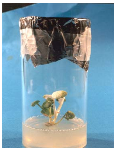
شکل ۲- انتخاب گیاهان تراریخت شده در محیط کشت حاوی عامل انتخابی کانامایسین. گیاه تراریخت نشده در محیط انتخاب، به رنگ سفید درآمده و گیاه تراریخت شده دارای ژن NPT II سبز باقی مانده است.

بیان ژن GUS منجر به تولید آنزیم \beta -گلوکونیداز می‌شود که به صورت طبیعی در گیاه وجود ندارد. این آنزیم قادر است ترکیب X-Gluc را بشکند و تولید رنگ آبی کند. به منظور بررسی بیان ژن GUS در گیاهان تراریخت شده، قطعات برگ و دمبرگی از گیاهان مقاوم به کانامایسین تهیه شد و در بافر حاوی X-Gluc در دمای ۳۷ درجه سانتی‌گراد قرار گرفت. ظهور رنگ آبی در آن‌ها نشان‌گر بیان ژن GUS در گیاهان تراریخت شده بود (شکل ۴). بیش از ۷۰٪ از گیاهان مقاوم به کانامایسین بیان ژن GUS را نشان دادند.