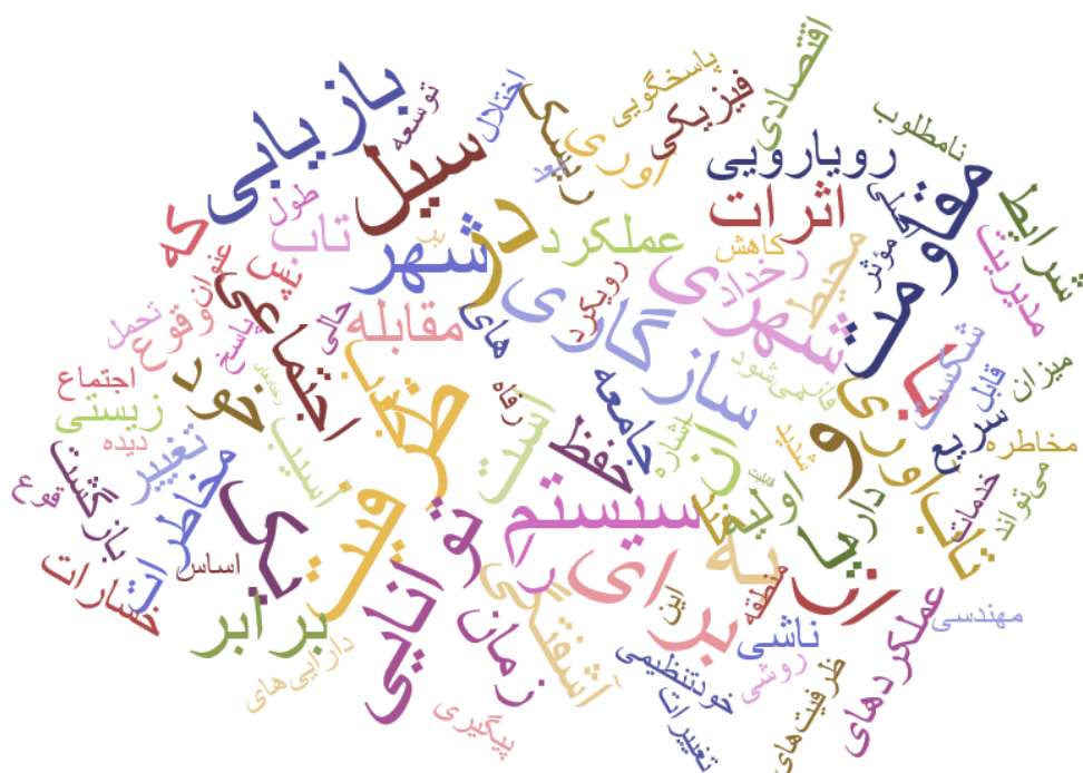
شکل ۱: ابر کلمات به‌کار رفته در تعاریف تاب‌آوری