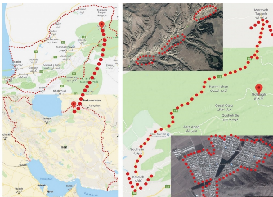
شکل ۱: روستاهای آسیب دیده و محدوده جابه جا شده پس از سیل ۸۴ استان گلستان

بارش باران های شدید در مرداد سال ۱۳۸۴ در نواحی شرقی استان گلستان منجر به وقوع دو سیل ویرانگر شد که از خسارت بارترین سیل های رخ داده در کشور بودند. (محمدی استادکلایه و همکاران، ۱۳۹۴) بنیاد مسکن انقلاب اسلامی در جهت تأمین اسکان جمعیت آسیب دیده و به منظور کاهش آسیب پذیری کالبدی مجدد روستاها در اثر وقوع سیلاب های آتی اقدام به جابه جایی یازده روستای شهرستان کلالة بانام های قزل اطاق، آق طوقه، چاتال، خوجه لر، کروک، پاشایی، قپان علیا، قپان سفلا، سیدلر، شیخلر و دوجی که در سیلاب های اخیر گرگان رود و سرشاخه های آن خسارات زیادی دیده بودند، به منطقه پیشکمر نمود. (پهلوان زاده و همکاران، ۱۳۹۱) از جابه جایی و تجمیع روستاها در این محدوده، شهر جدید فراغی شکل گرفت. در شکل ۱ موقعیت محدوده مورد مطالعه را نشان داده شده است.