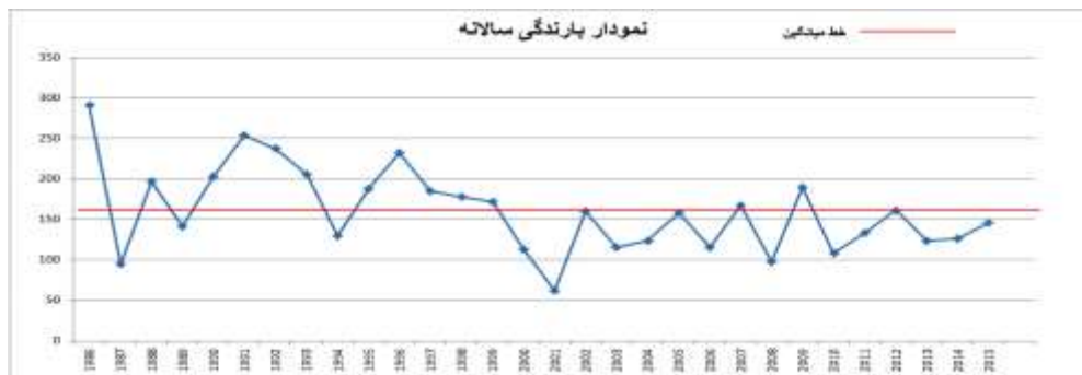
شکل ۴: تفکیک دو دوره مرطوب و خشک در بررسی سی ساله

شکل ۵، طبقات بارش سالانه در سری زمانی سی ساله محدوده مطالعه را بر اساس شاخص استاندارد بارش (SPI) نشان می‌دهد. ترسالی و خشکسالی با شدت‌های مختلف همچنین تغییرات بارندگی سالانه در سال‌های نرمال رخدادهایی هستند که در این نمودار ارائه گردیده‌اند.