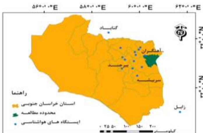
شکل ۲: موقعیت ایستگاه‌های هواشناسی محدوده مطالعه

با استفاده از داده‌های بارش روزانه ۱۵ ایستگاه هواشناسی در اطراف محدوده مطالعه (شکل ۲)، بارندگی سالانه در طول دوره سی ساله (۱۹۸۶-۲۰۱۵ میلادی) استخراج گردید سپس این داده‌ها برای محدوده مطالعه به روش IDW ۱ در نرم‌افزار ArcGIS میانمایی و با استفاده از شاخص استاندارد بارش (SPI ۲ ) سال‌های خشک، تر و نرمال مشخص شدند. برای تکمیل سال‌های فاقد داده بارندگی هریستگاه از روابط همبستگی با ایستگاه‌های مجاور و نرم‌افزار SPSS استفاده شد.