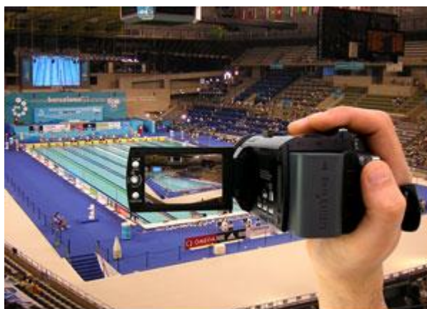
شکل ۲. دوربین های مادون قرمز