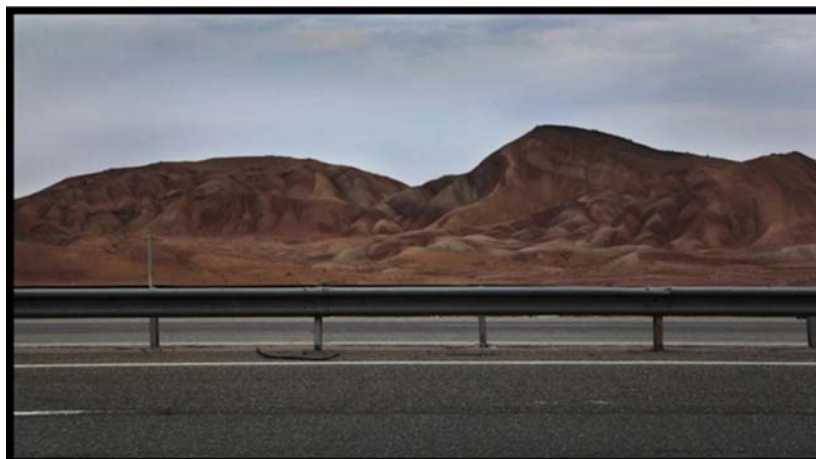
شکل (۵) گنبد نمکی نامنظم در مجاورت آزادراه قم- کاشان

جاذبه ها و قابلیت های گردشگری: آشنایی عموم گردشگران با پدیده های ژئومورفولوژیک و لندفرم های حاصل از تکتونیک نمکی نظیر پدیده ی پای پینگ و غیره؛ جاذبه های آموزشی (تخصصی) در زمینه ی شناخت تکتونیک، ماگماتیسم، ژئومورفولوژی ساختمانی و غیره.