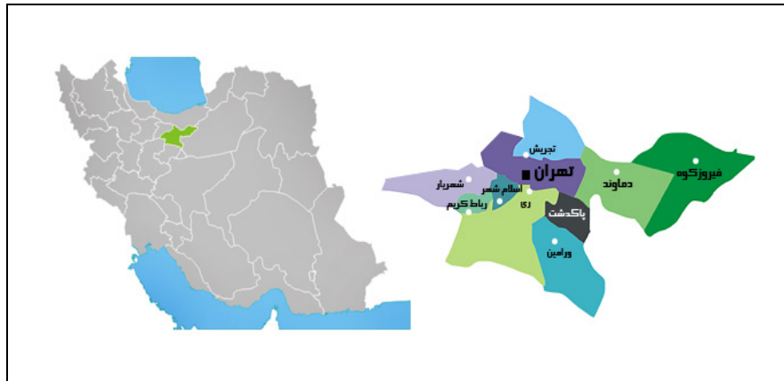
شکل (۱) موقعیت منطقه مورد مطالعه