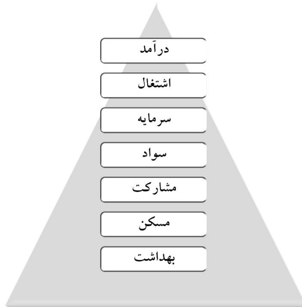
شکل (۳) هرم نیازهای اساسی توسعه روستایی در دهستان شوسف شهرستان نهبندان