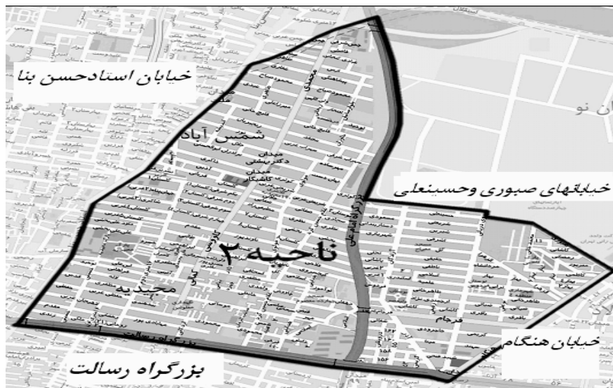
شکل (۱) مرز بندی ناحیه دو (محدوده مورد مطالعه)

این ناحیه متشکل از سه محله با ویژگی های متفاوت تیپولوژیک بوده و از این دیدگاه امکان مناسبی برای مقایسه را فراهم می آورد، به گونه ای که کالاد محله ای ساخته شده بر مبنای طرح و برنامه قبلی است، مجیدیه حاصل گسترش یک هسته روستایی در چهار دهه گذشته است و شمس آباد حاصل گسترش هسته روستایی در دوره اخیرتر است.