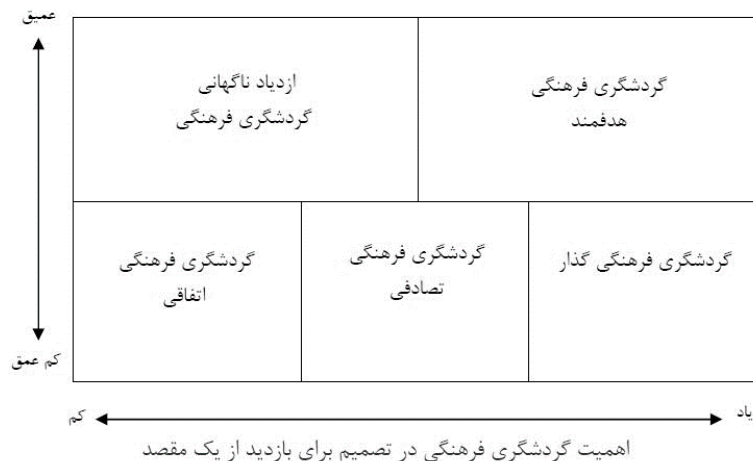
شکل (۳). گردشگری فرهنگی

تولید فرهنگی خواهد شد. شکل (۳). در این مدل، شاخص‌های مورد استفاده، تجربه عمیق و به دنبال آن اهمیت گردشگری فرهنگی در تصمیم برای بازدید از یک مقصد است.