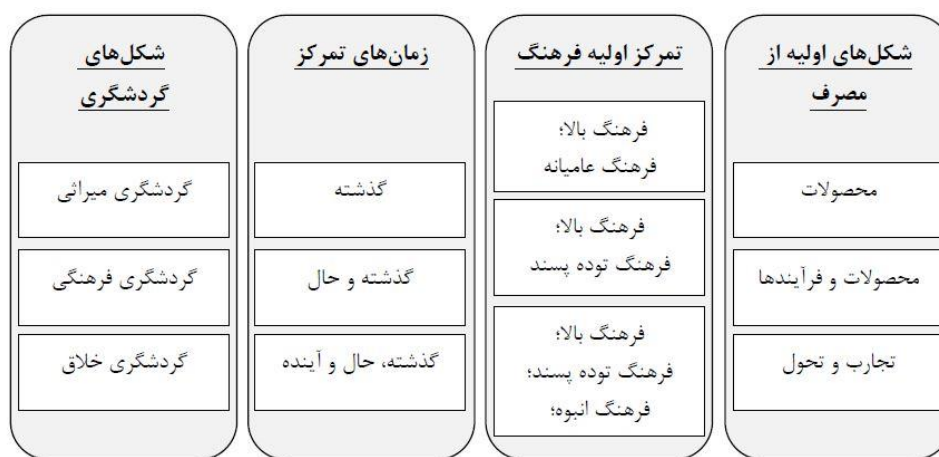
شکل (۲). ویژگی‌های گردشگری فرهنگی در کنار میراث فرهنگی و گردشگری خلاق

با این حال بیشتر موارد ذکر شده مبتنی بر محصول است (OECD, 2009)، به همین دلیل به هیچ طریقی نمی‌توان جلوی کالایی شدن فرهنگ را گرفت چرا که در اهمیت نقش محصولات فرهنگی در توسعه گردشگری جهت کسب سود بالاتر در مناطق مختلف هیچ شکی وجود ندارد. تجارب فرهنگی می‌تواند منجر به افزایش محصولات فرهنگی و همچنین جذب گردشگران جدید به منطقه شود که در این صورت جذب بازدیدکنندگان بر اساس عوامل انگیزشی مبتنی بر فرهنگ صورت می‌گیرد. گزارش سازمان همکاری اقتصادی و توسعه سازمانی در سال ۲۰۰۹ که نشان‌دهنده تأثیر فرهنگ بر روی گردشگری است، بیان می‌کند که گردشگری فرهنگی می‌تواند نقش عمده‌ای در توسعه مناطق مختلف، گرد هم آوردن مردم با سنت‌های متعدد و به اشتراک‌گذاری آداب و رسوم و ارزش‌ها داشته باشد. یکی از مهم‌ترین مشکلات در این زمینه از نظر راج این است که: اصطلاح «فرهنگ» به شدت در طول دو دهه گذشته مورد بحث قرار گرفته و هیچ تعریف روشن و مورد قبولی از مفهوم آن توسط جامعه به عنوان یک کل نشده است. این مورد ارتباط نزدیکی با هویت ملی ما دارد که مردم را در سازمان‌های اجتماعی، محلی و ملی مانند دولت‌های محلی، نهادهای آموزش و پرورش، جوامع مذهبی، کار و فراغت و تفریح قرار می‌دهد (Raj, 2012)؛ در نتیجه در چنین شرایطی چگونه فرهنگ می‌تواند یک ابزار و اهرمی در توسعه گردشگری محسوب شود. پس اولین گام در توسعه گردشگری فرهنگی در یک جامعه، تعریف روشنی از فرهنگ آن جامعه و محصولات فرهنگی آن است. رایج‌ترین روش صورت گرفته در برخورد با گردشگری فرهنگی کاهش ناملموس یک محصول در بازار و ایجاد تمایز بین محصولات و تبدیل آنها به محصولات مختلف و مرتبط با مفاهیم گردشگری میراث فرهنگی، گردشگری فرهنگی و گردشگری خلاق است. شکل (۲).