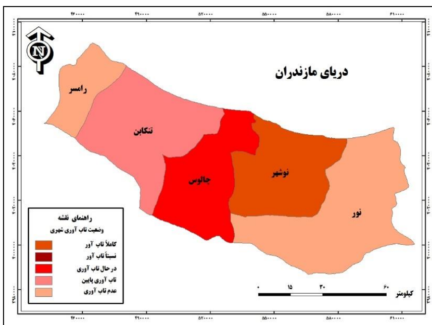
شکل (۲). نقشه شهرهای ساحلی غرب استان مازندران بر اساس وضعیت تاب آوری شهری

مقایسه شهرهای ساحلی غرب استان مازندران بر اساس وضعیت تاب آوری کالبدی-زیرساختی با استفاده از تکنیک ایداس