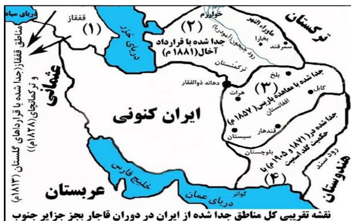
شکل (۲). تغییرات جغرافیایی در مرزهای شمال و شمال شرق بعد از قرارداد آخال، گلستان و ترکمنچای

۹۰-۹۱). روس‌ها در ابتدا نواحی شمال غربی ایران را تصرف نمودند و از ضعف ساختاری ارتش ایران و عقب‌ماندگی آن نهایت استفاده را برده و طی دو قرارداد گلستان ۱۱۹۲ ش برابر با ۱۸۱۳ میلادی و ترکمن‌چای برابر با ۱۸۲۸ م/۱۲۰۷ ش موفق به تصرف نواحی گسترده‌ای از ایران شدند و عملاً تغییرات جغرافیایی در مرزها و ژئوپلیتیک شمال ایران به وجود آمد. این تغییرات در شکل (۲) نشان داده شده است.