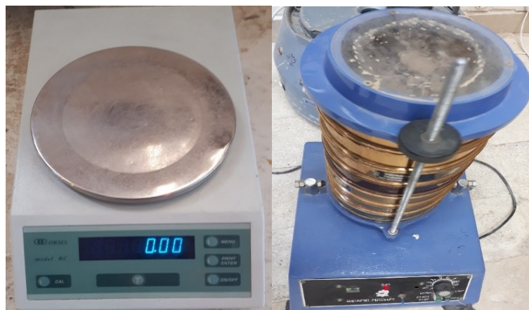
شکل (۳). دستگاه شیکر و ترازوی مورد استفاده جهت آنالیزها