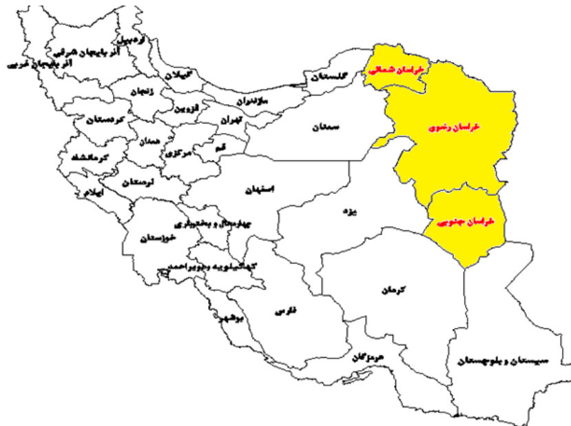
شکل (۱). موقعیت قرارگیری منطقه خراسان (سه استان خراسان شمالی، خراسان رضوی و خراسان جنوبی) در سطح کشور