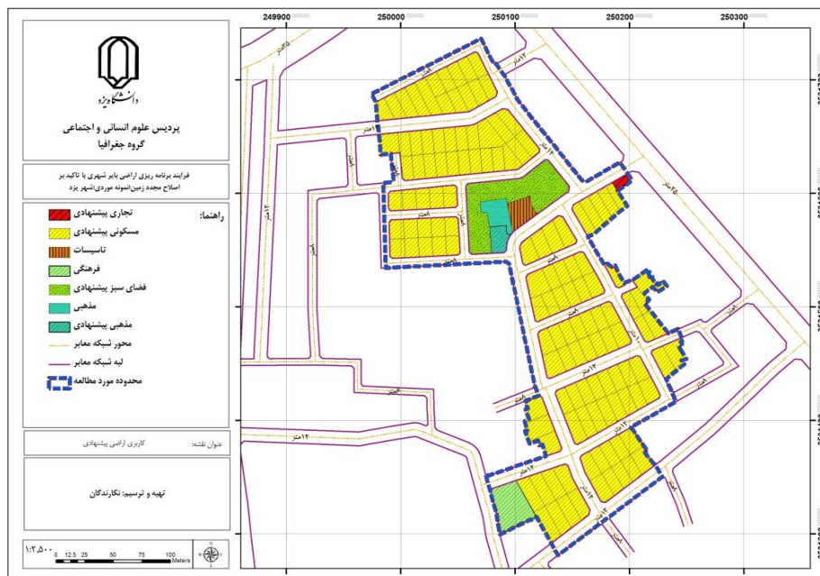
شکل (۳). کاربری اراضی پیشنهادی

در محدوده مورد مطالعه، ۹۲ قطعه زمین وجود دارد که در ابتدا برای انجام محاسبات، باید شماره‌گذاری شوند. شکل (۳) کاربری اراضی پیشنهادی را نشان می‌دهد.