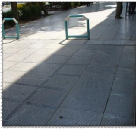
شکل (۳) مسیر عابر پیاده مطلوب و نامطلوب در محورهای انتخابی