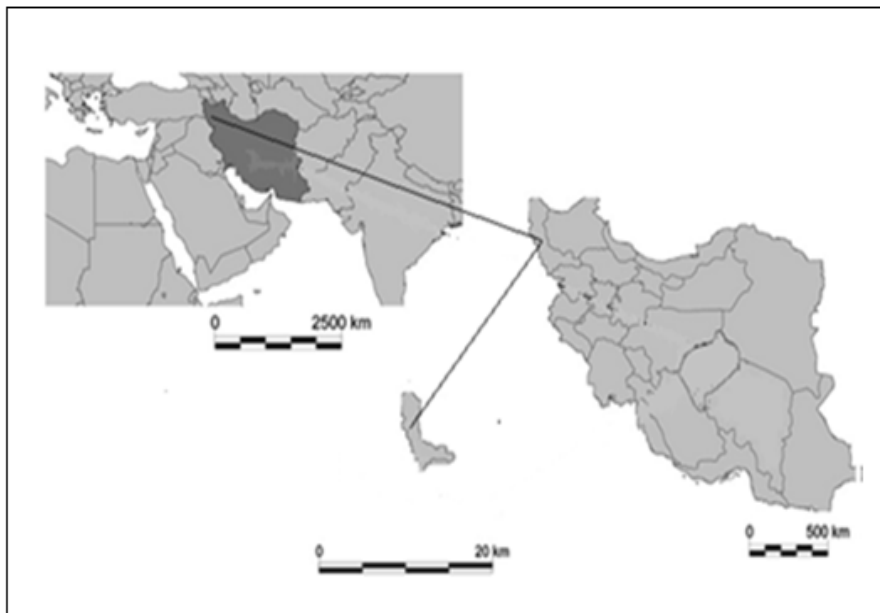
شکل (۱) موقعیت شهر ارومیه در جهان و ایران