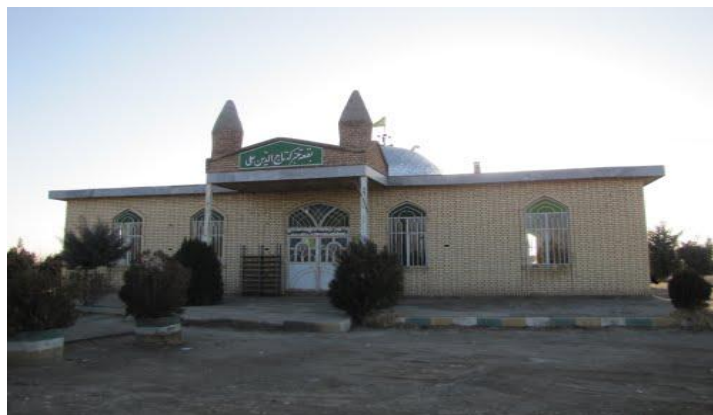
شکل (۲) زیارتگاه تاج الدین علی واقع در روستای قیچاق در دهستان مرحمت آباد شمالی

بازسازی آن با مساعدت شجاع الدوله حاکم مراغه در اواخر قاجار که به دست مردم منطقه بصورت بقعه‌ای چهارگوش با گنبد دوار از آجرپخته ساخته شده است (شکل ۲). زیارتگاه تاج الدین علی، مبین قدمت هزاران ساله است. بررسی‌ها نشان می‌دهد بطور متوسط ماهانه حدود ۲۴۰۰ نفر گردشگر از شهرها و روستاهای دور و نزدیک به این مکان مقدس مراجعه می‌کنند (اداره اوقاف شهرستان میاندوآب، ۱۳۹۲).