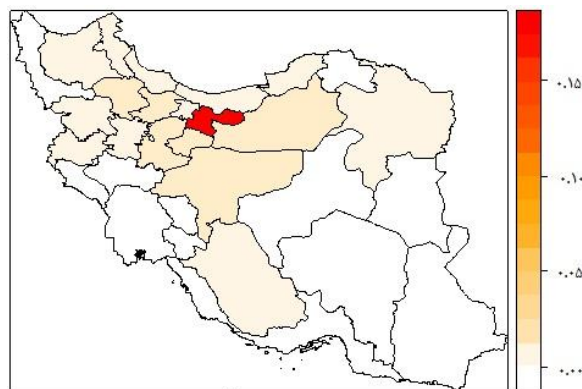
نقشه (۱). اثرات سرریز سرمایه‌گذاری صنعتی استان تهران بر سایر استان‌های کشور

ضریب اثرگذاری غیرمستقیم (اثرات سرریز) هر یک از متغیرها، را می‌توان برای هر یک از استان‌ها به صورت مجزا بدست آورد. تفکیک استانی این اثرات، دید بهتری از اثرات سرریز به برنامه‌ریزان و سیاست‌گذاران ملی می‌دهد. در این بخش، تنها اثرات سرریز سرمایه‌گذاری صنعتی که مورد هدف این تحقیق می‌باشد بطورخاص و جزئی به تفکیک هریک از استان‌ها بیان می‌شود. بررسی این اثرات به تفکیک هر استان نشان می‌دهد که بیشترین اثرات سرریز سرمایه‌گذاری صنعتی، مربوط به استان تهران است. اثرات سرریز سرمایه‌گذاری صنعتی این استان بر سایر استان‌ها به عنوان نمونه، در نقشه شماره ۱ آمده است.