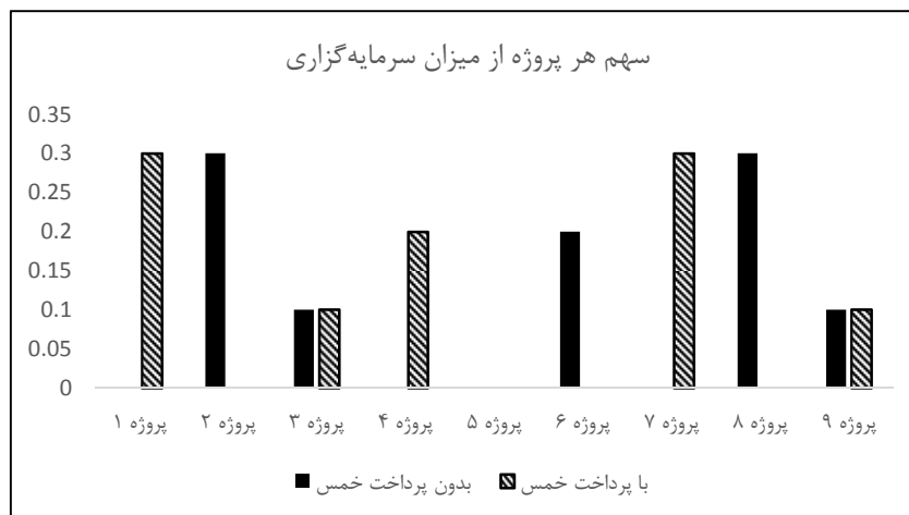
شکل ۲- مقایسه میزان تخصیص سرمایه در پروژه‌های مختلف در دو حالت بدون محاسبه خمس و با محاسبه خمس