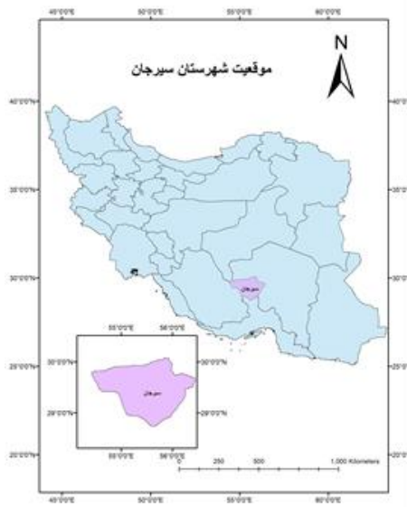
شکل ۱. موقعیت شهرستان سیرجان روی نقشه