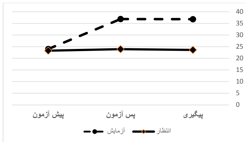
نمودار ۱- تأثیر توان بخشی شناختی رایانه‌ای بر عملکرد حافظه کاری بیماران مبتلا به اسکروزیز چندگانه