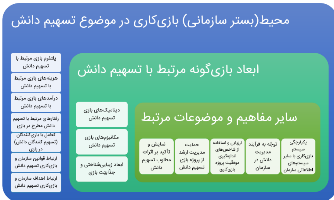
شکل ۴ - مدل‌سازی بصری یافته‌های پژوهش

دلفی برای طیف گسترده‌ای از سؤالات پیچیده، و در طیف وسیعی از زمینه‌ها استفاده می‌شود. در این روش، نظرات نخبگان مورد توجه است. به طور کلی روش دلفی، شامل چندمرحله اساسی است (اوکولی و پاولوسکی، ۲۰۰۴). در مرحله اول، مسئله پژوهش تعریف می‌شود و براساس آن ویژگی‌های لازم برای شرکت‌کنندگان در پانل دلفی تعیین می‌گردد. سپس نامزدهای مشارکت در این پانل شناسایی و از آنان دعوت به عمل می‌آید. در مرحله دوم روش دلفی، پژوهشگر، عواملی را از پیش تعیین و آن‌ها را برای نظرخواهی در اختیار اعضا قرار دهد. در مرحله سوم، اعضا میزان اهمیت عوامل را تعیین کرده و تعدادی از مهم‌ترین آن‌ها را انتخاب می‌کنند. مرحله چهارم به بازنگری در میزان اهمیت عوامل براساس نتایج قبلی اختصاص دارد (علیدوستی ۱۳۸۵). انتخاب اعضای مناسب برای پانل دلفی از مهم‌ترین مراحل روش به حساب می‌آید؛ چرا که اعتبار نتایج کار بستگی زیادی به شایستگی و دانش این افراد دارد (پاول، ۲۰۰۳). جهت استفاده از روش دلفی، محققان با ۴ تن از اساتید دانشگاه که در زمینه مدیریت دانش متخصص بوده و با مفاهیم بازی‌کاری نیز آشنا بودند، مصاحبه‌ای نیمه‌ساختار یافته داشته و ضمن تشریح مراحل روش نظریه‌پردازی داده‌بنیاد، ارائه یافته‌ها و مدل‌های بصری، درخصوص ارزیابی نظریه از ایشان نظرخواهی نمودند. پس از دریافت نظرات خبرگان، پیشنهادات مشترک و مطلوب از حیث جامع بودن و ارتباط با موضوع، جمع‌بندی شد.