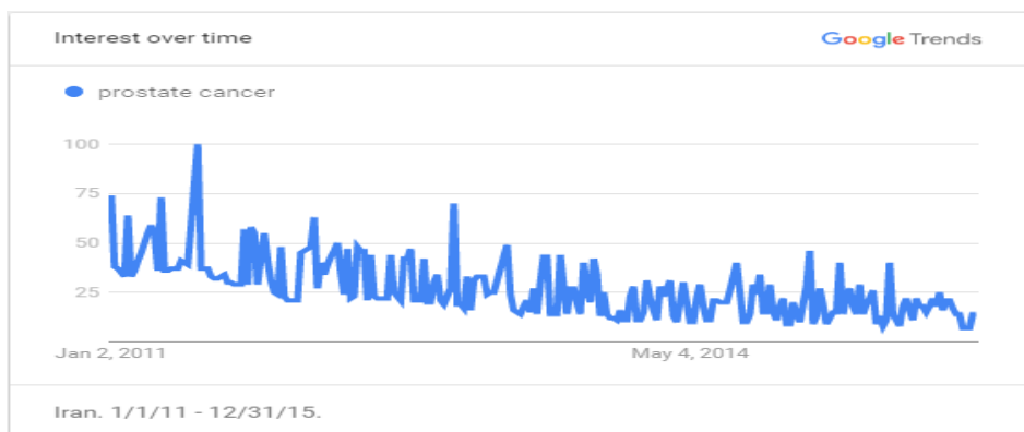
نمودار ۲. شاخص حجم جستجوی کلیدواژه «Prostate cancer»