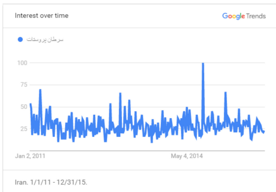
نمودار ۱. شاخص حجم جستجوی کلیدواژه «سرطان پروستات»

در نمودار (۲)، شاخص حجم جستجوی کلیدواژه « prostate cancer » در دوره زمانی یک ژانویه ۲۰۱۱ تا سی و یک دسامبر ۲۰۱۵ میلادی به تصویر کشیده شده است. طبق نمودار، یافته‌های حاصل از گوگل ترندز در این کلیدواژه نشان می‌دهد حجم جستجوی کاربران در موتور جستجوی گوگل بین سال‌های ۲۰۱۱ تا ۲۰۱۵ میلادی شیب نزولی داشته است.