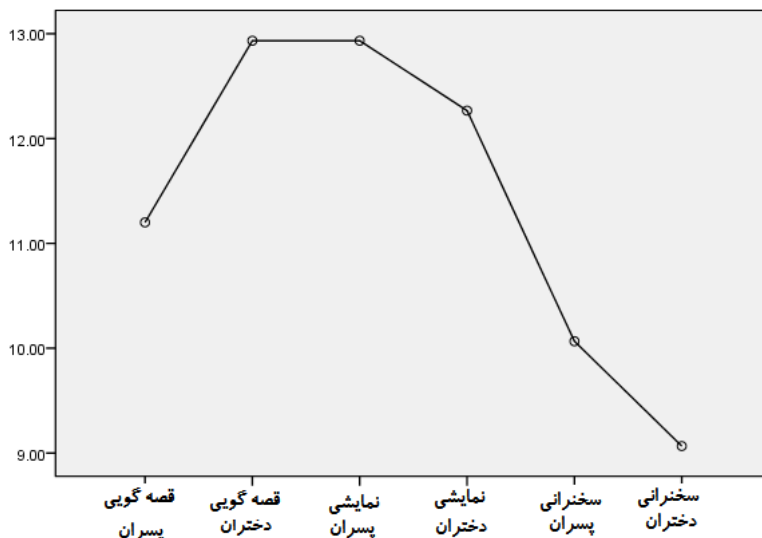
نمودار شماره ۲- بررسی وضعیت حالات تعاملی روش * جنسیت در باب یادگیری میراث ناملموس

جهت تعیین تفاوت بین حالات تعاملی شش گانه از آزمون تعقیبی ال اس دی استفاده شد که نتایج آن در جدول زیر ارائه می‌شود. لازم به ذکر است حالت روش قصه‌گویی دختران و نمایش خلاق مشارکتی پسران بیشترین اثر و حالت سخنرانی دختران کمترین اثر بر یادگیری میراث ناملموس دارند.