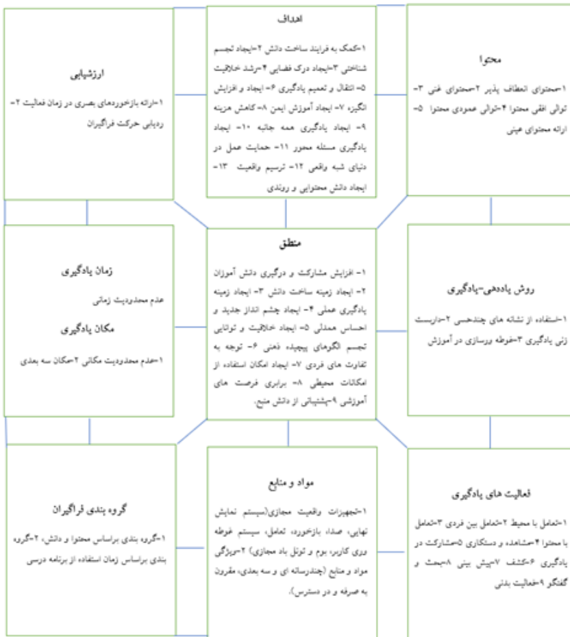
شکل شماره ۲: الگوی برنامه‌درسی مبتنی بر واقعیت مجازی در درس علوم

با توجه به نتایج حاصل از سنتز پژوهی و کدگذاری باز و محوری، به‌طور کلی الگوی برنامه‌درسی مبتنی بر واقعیت در درس علوم دوره ششم ابتدایی به‌صورت زیر می‌باشد: