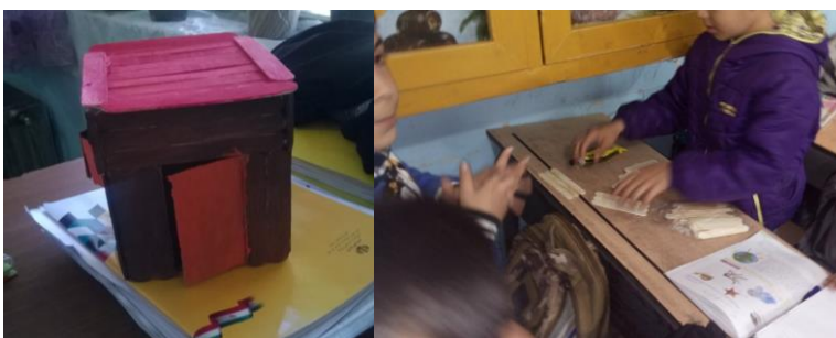
شکل ۹- تلفیق کاردستی و خلاقیت ذهنی (هوش چندگانه)