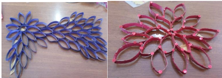
شکل ۷- تلفیق هنر تجسمی با نقاشی همراه با وسایل دور ریختنی