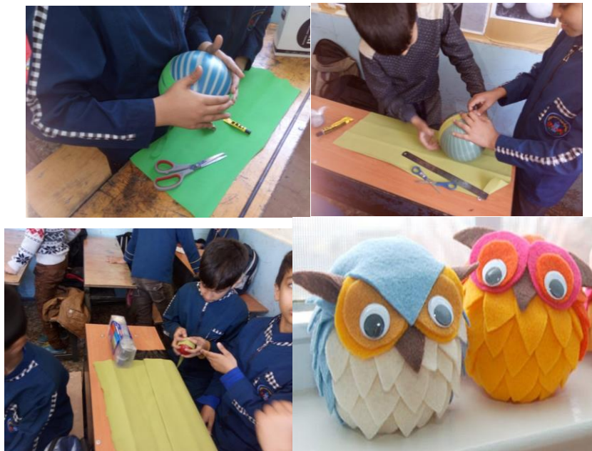
شکل ۳- تلفیق نقاشی با هنر دستی (هنر تجسمی)

شکل ۲- تلفیق داستان سرایی و نمایش همراه با موسیقی خلاقانه دانش آموزان