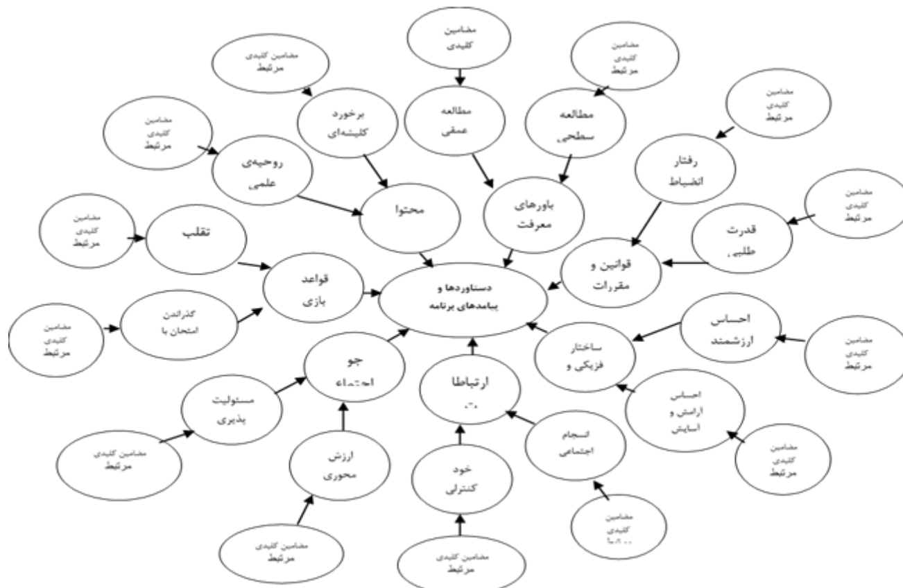
نمودار ۱. شبکه‌ی مضامین دستاوردها و پیامدهای برنامه‌درسی ضمنی دانشگاهی