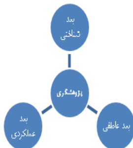
شکل ۱- ابعاد سه‌گانه؛ شناختی، عاطفی و عملکردی نگرش جامع پژوهشگری

بعد عملکردی نگرش جامع پژوهشگری: در این بعد، برنامه‌های درسی رشد دهنده نگرش پژوهشگری باید مهارت‌های عملی لازم برای فعالیت پژوهشی را رشد دهند. صاحب‌نظرانی چون آرتور (۲۰۰۰)، ماتیلا (۲۰۰۷)، کلیک (۲۰۰۹)، دینز (۲۰۱۰) بر خلق فرصت‌های عملی به‌منظور ایجاد زمینه‌های رشد مهارت‌های عملی پژوهشی تأکید داشته‌اند.